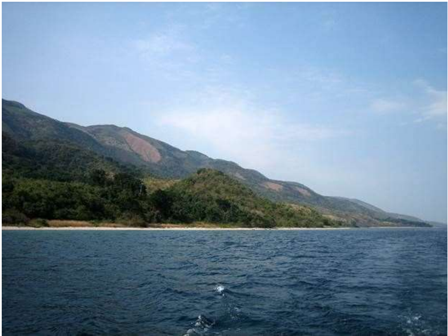
Озеро Танганьика – самое длинное озеро в мире. Расположено на высоте 774 метра. Здесь обитают более 250 видов животных, большую часть из которых вы больше нигде не встретите.