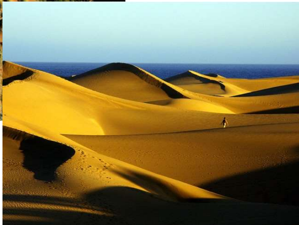
Дюны и барханы пустыни Сахары.