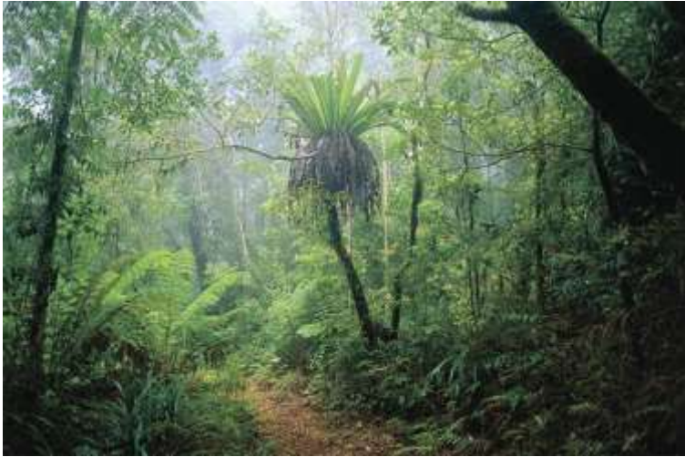
влажный экваториальный лес