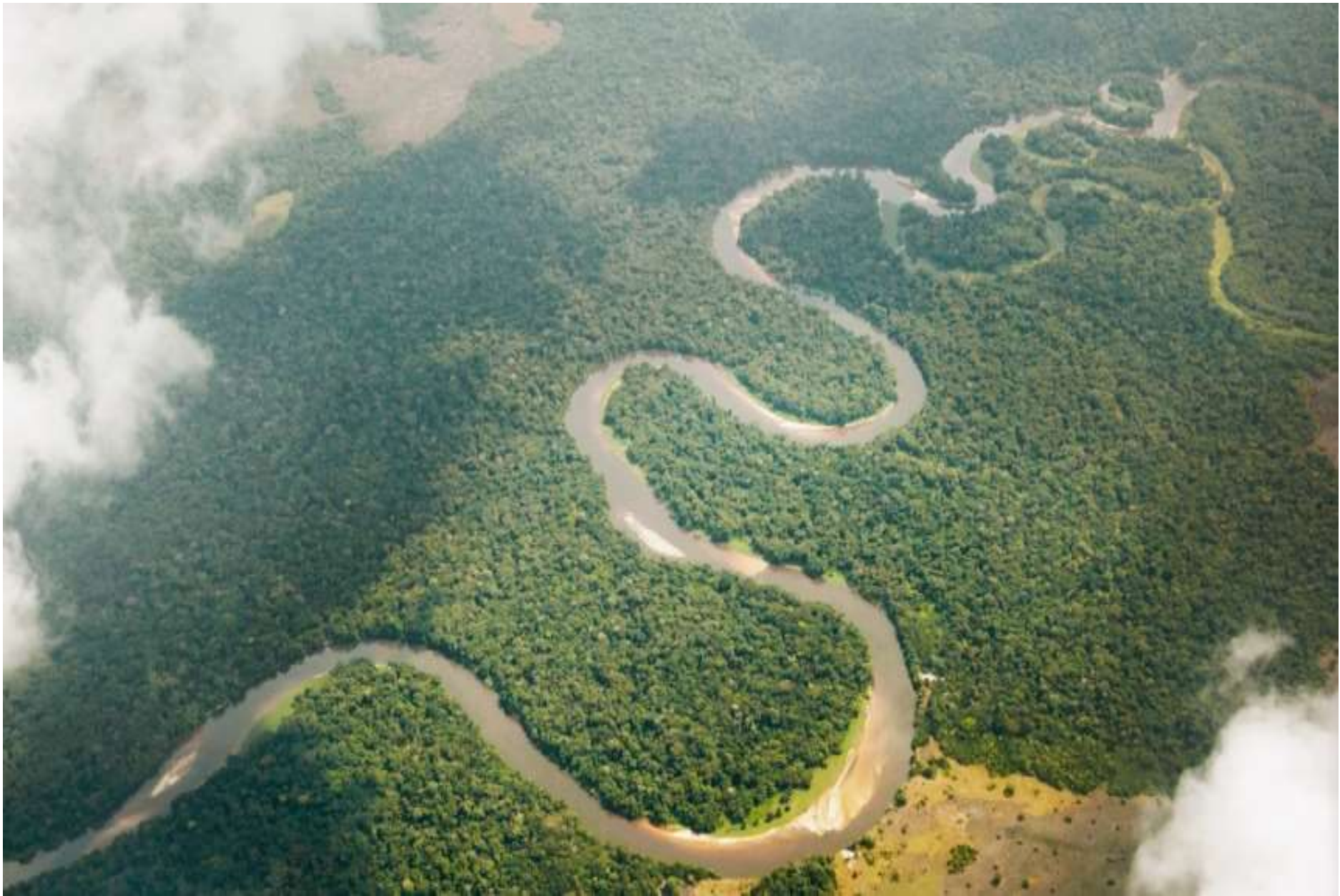
Река Конго – самая многоводная река в центральной Африке.