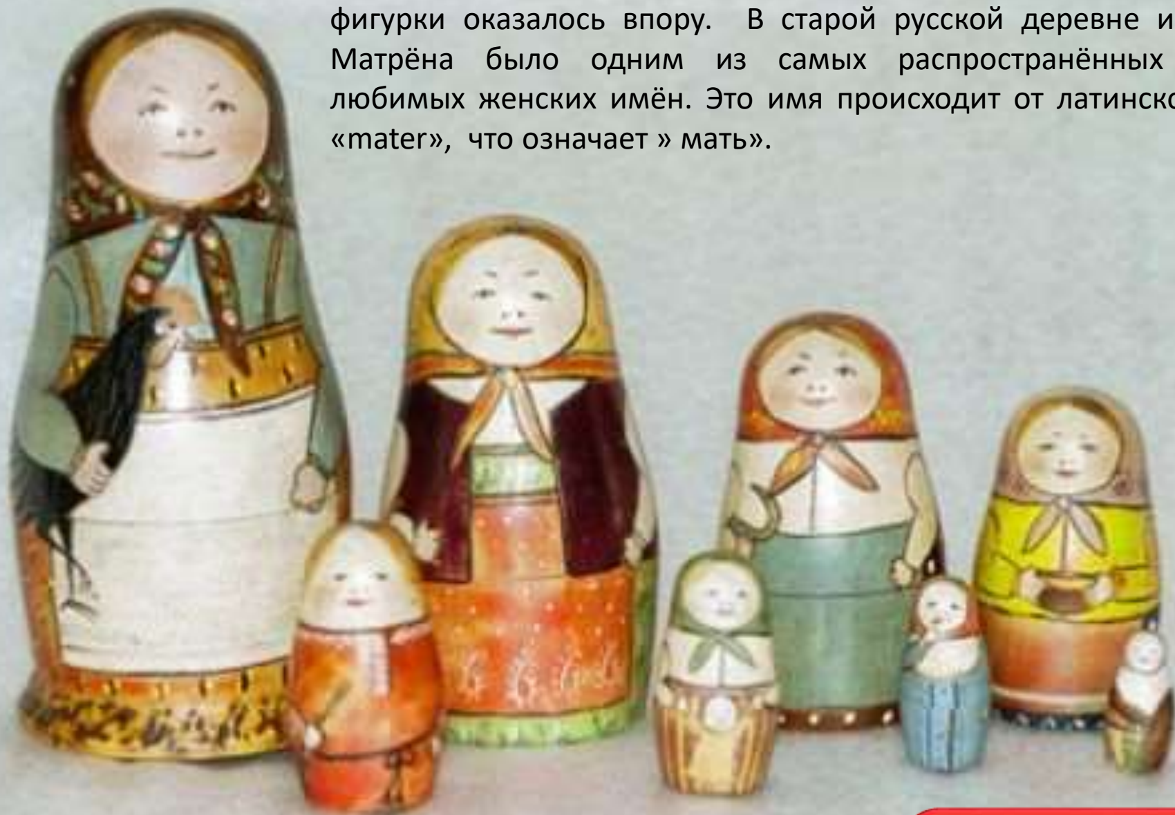
Первая русская матрешка

Название «матрёшка» для деревянной разъемной расписной фигурки оказалось впору. В старой русской деревне имя Матрёна было одним из самых распространённых и любимых женских имён. Это имя происходит от латинского «mater», что означает » мать».