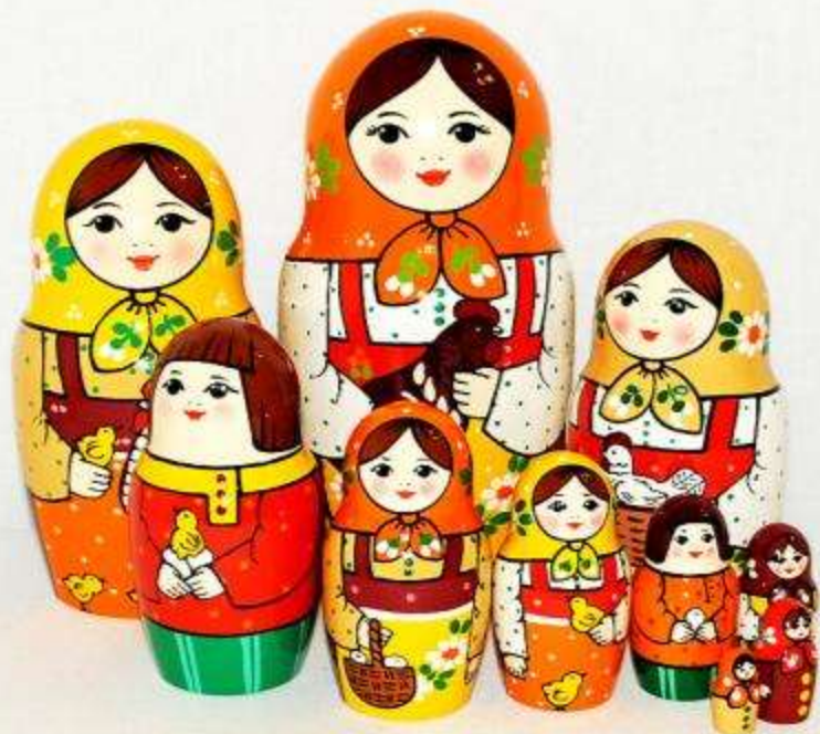
Матрешки «Деревенская семья»