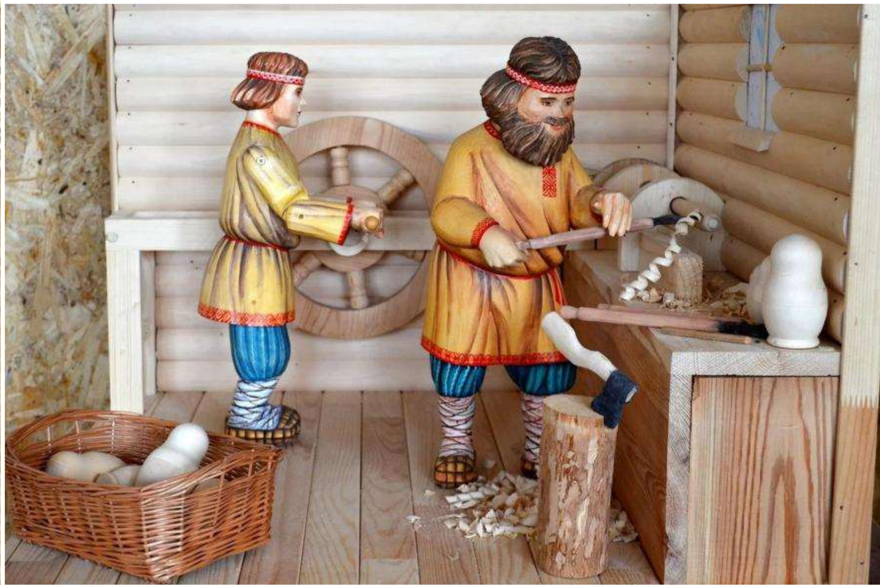
Механическая игрушка «Матрешечники»