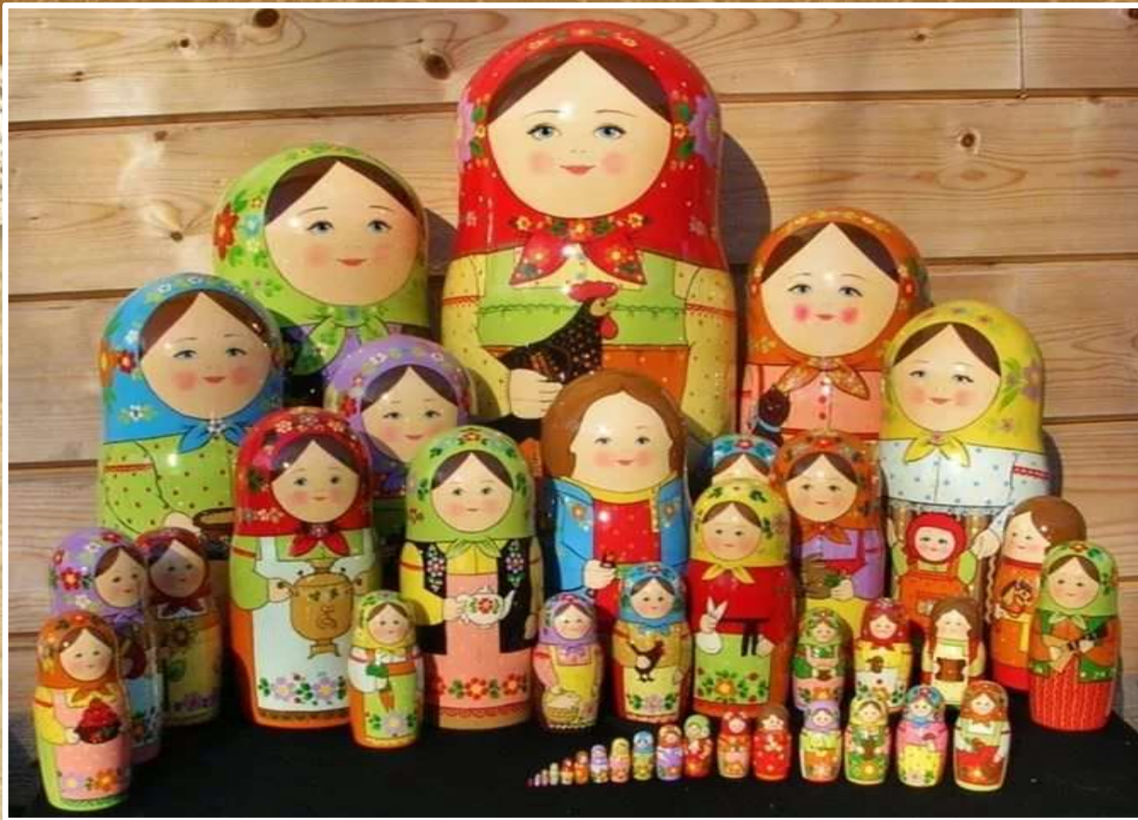
Матрешки «Деревенская семья»