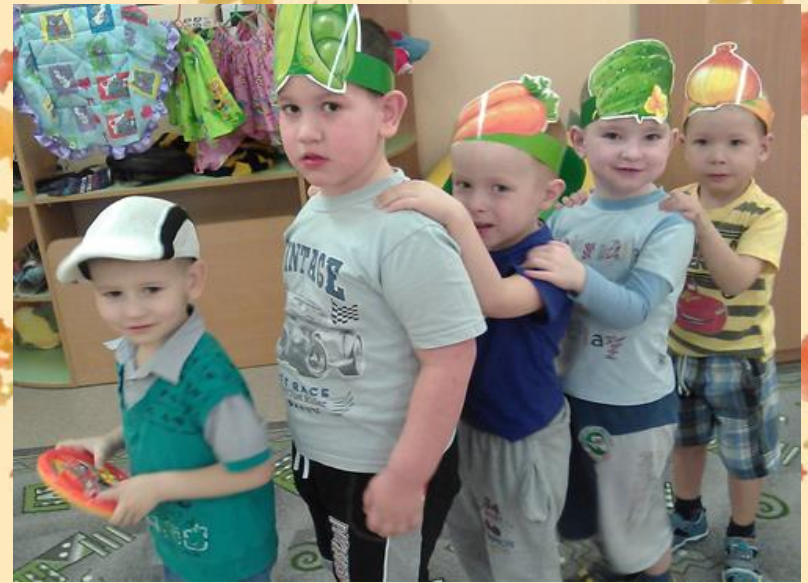
НАБЛЮДЕНИЕ НА ПРОГУЛКЕ